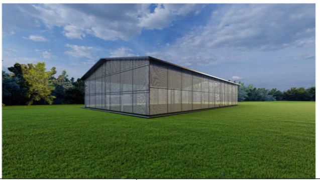
IMAGEM 3D DO EXTERIOR DA QUADRA SEM ESCALA