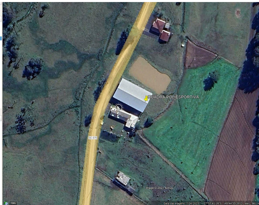
Figura 03 – Localização Implantação do Campo

Conforme imagem a seguir, podemos observar o posicionamento da quadra de grama sintética na localização escolhida.