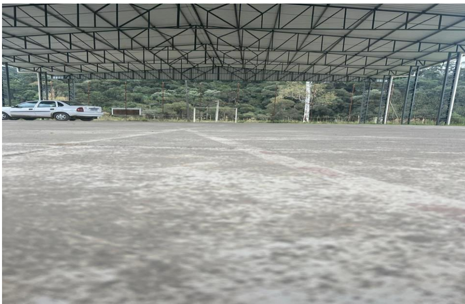
Figura 05 – Área de locação da quadra