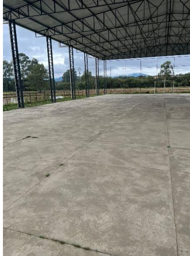
Figura 01 – Imagem LOCAL