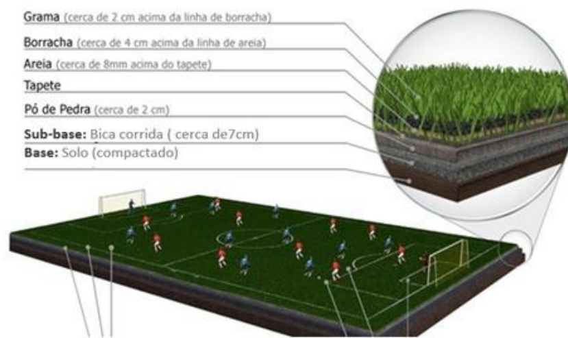
Figura 09– Detalhe Ilustrativo de Instalação e Revestimento (Gramma Sintética)