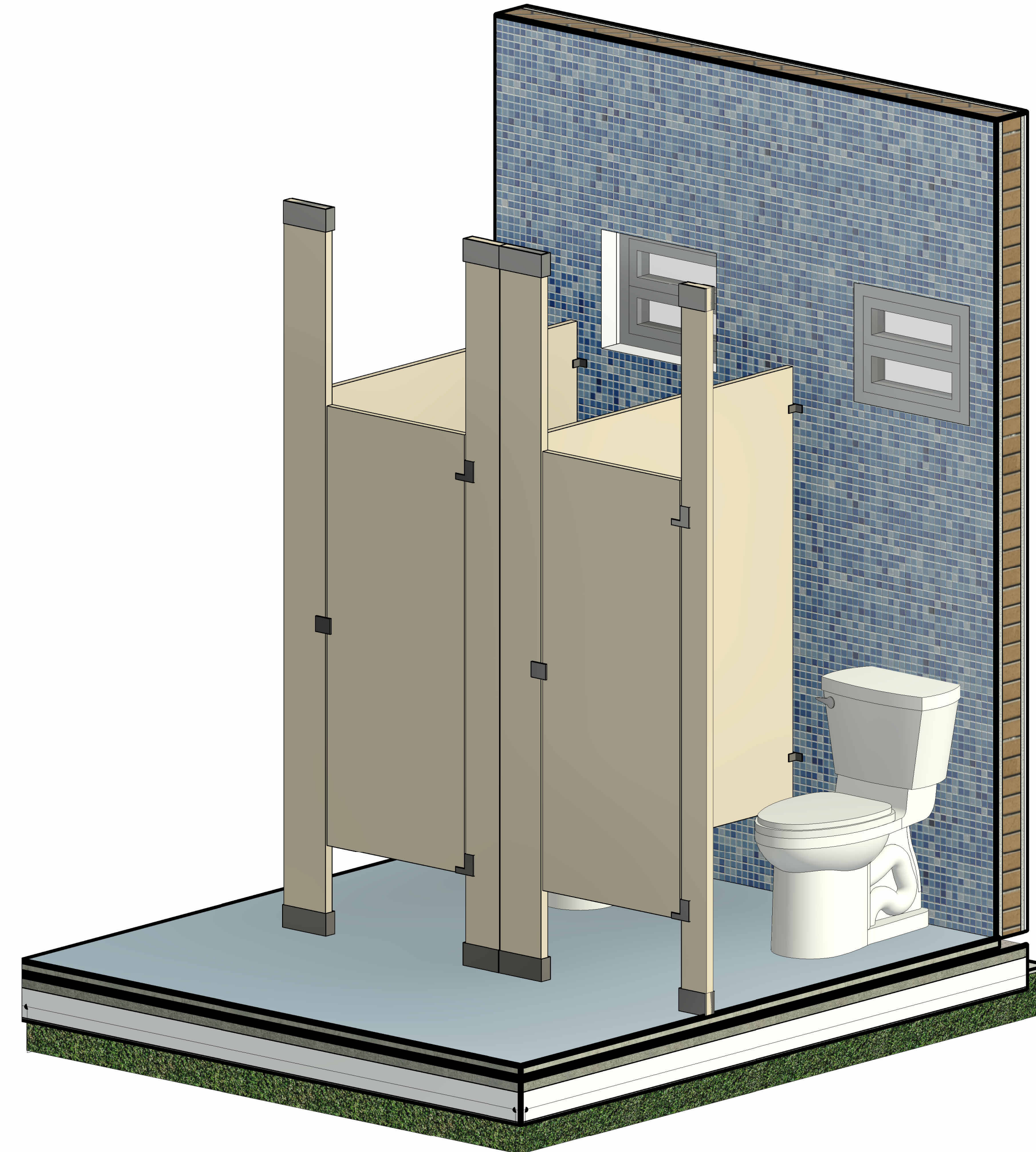
3 CABINE DE GRANITO PORTA DE ALUMINIO BRANCO