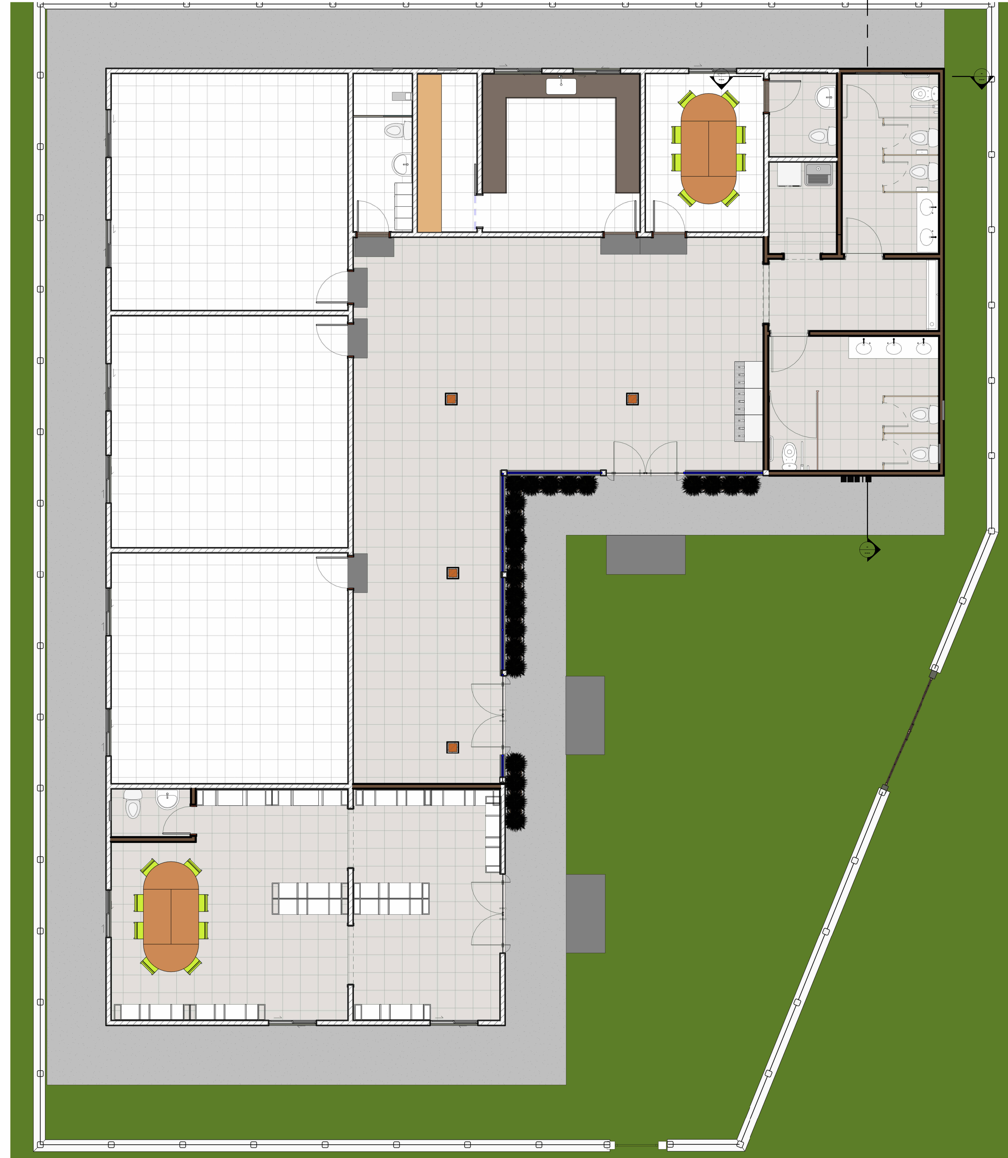
1 TÉRREO 1 : 50