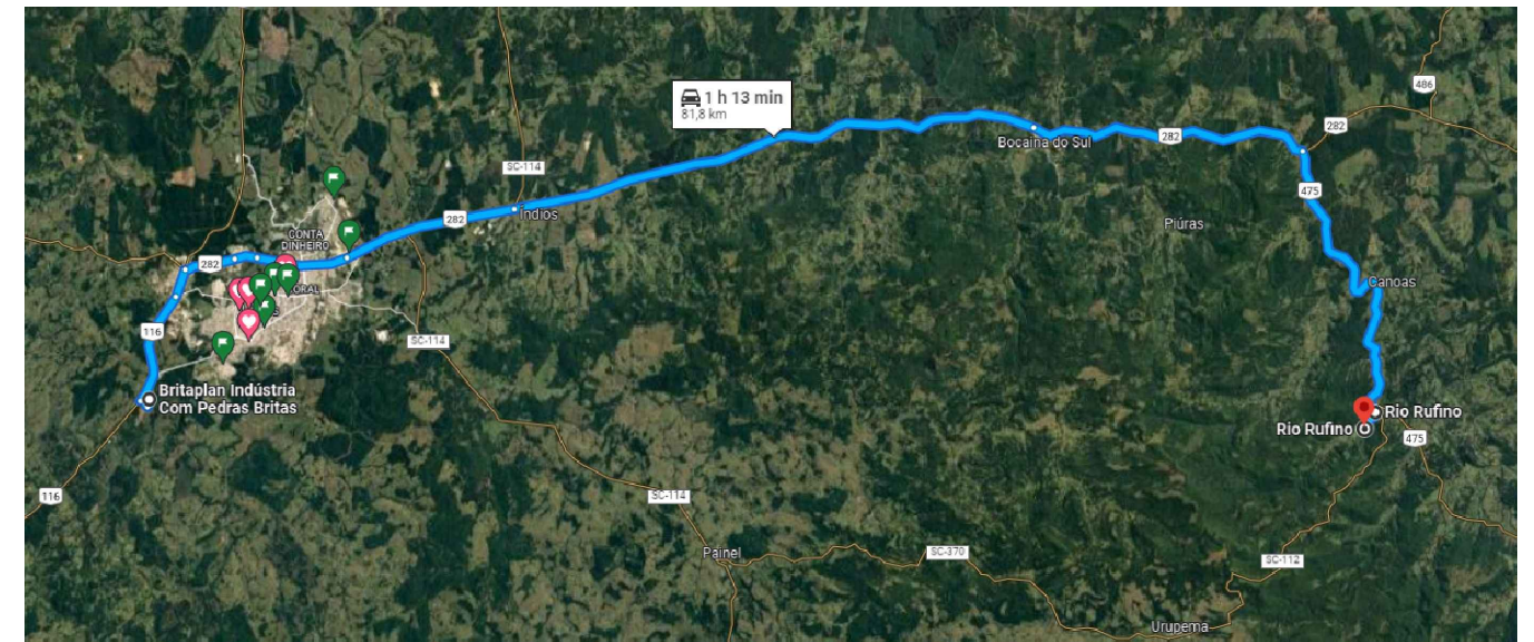
DISTÂNCIA ATÉ A DISTRIBUIDORA DE MATERIAIS PÉTRIOS - 81,80KM